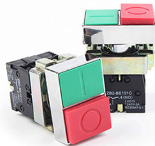
Кнопка управления XB2-BL8425