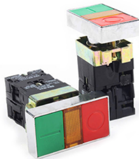
Кнопка управления XB2-BW8465 (BW2)